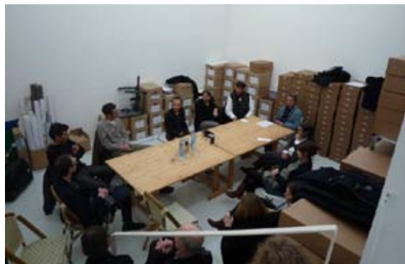
CNEAI= Centre national d'art contemporain consacré au domaine de la publication d'artiste et de l'oeuvre-média www.cneai.com